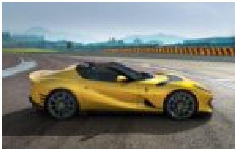
Ferrari 812 Competizione