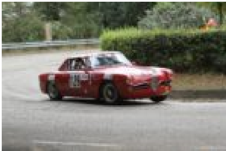
Alfa Romeo Giulietta Sprint