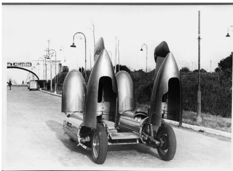
Bisiluro con fusi aperti

«Con Motori Capitale – afferma Fabio Casasoli, amministratore unico di Fiera Roma – allarghiamo l'offerta fieristica del nostro Polo a un ulteriore settore e con un nuovo format, all'insegna di una programmazione sempre più completa e capace di intercettare interessi il più possibile ampi e trasversali». La due giorni di motori, storia e bellezza si caratterizzerà per la sua estrema dinamicità e capacità di coinvolgere il pubblico. L'affascinante parte espositiva vedrà spesso i modelli storici posti a confronto con le ultime versioni moderne, oltreché con pezzi letteralmente unici, quali il motoscafo Kineo, la sola barca progettata e realizzata da Ferdinand Porsche per sé stesso nel 1993.